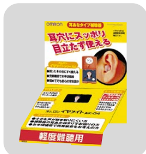
▲ AK-04 ダミー付紙POP POP.No DPD-R04