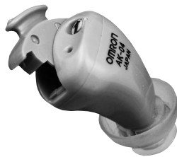
オムロン イヤメイト AK-04

小さな声が聞き取りにくい方 補聴器の耳あか詰まりでお困りの方 お手頃価格で両耳装着をお考えの方