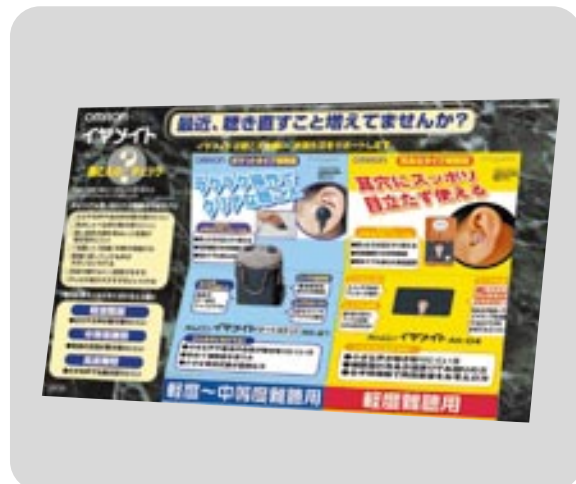
▲ イヤメイト大訴求POP POP.No DPA-RDAIS (単体商品POPは含まれません)

皆様の健康づくりをサポートする健康機器メーカー として、オムロンは環境保護の大切さを考えます。 商品だけでなく、店頭販促ツールにも、環境を 配慮した素材を使用しております。