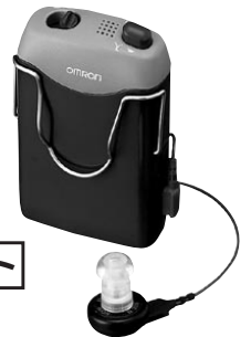
オムロン イヤメイト オートポケット AK-21

小さな声や普通の会話が聞き取りにくい方 初めて補聴器を使う方 小さな電池交換が面倒な方